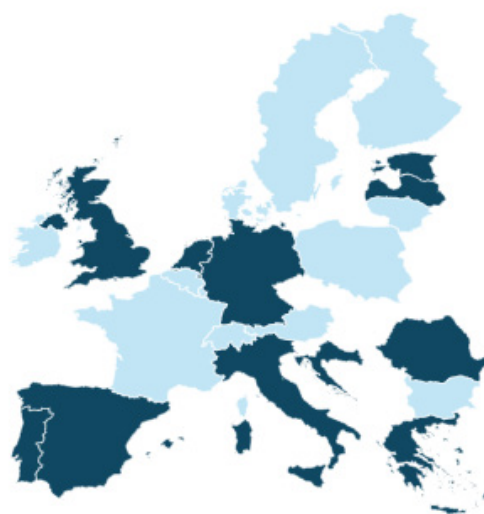
Bild 1. Visar de reglerade geografiska marknader där Bolaget har tillstånd och certifikat att bedriva verksamhet. Länder markerade i mörkblått representerar jurisdiktioner där Bolaget har erhållit specifika tillstånd och certifikat för dessa jurisdiktioner, länder markerade i ljusblått har Bolaget möjlighet att bedriva verksamhet genom erhållen MGA licens.

Gaming Corps har erhållit spellicenser och tillstånd för sin verksamhet från behöriga myndigheter i ett flertal jurisdiktioner, bland annat Grekland, Malta, Spanien, Storbritannien och Sverige. Bolaget erhöll även i december 2023 en ISO27001:2022-certifiering vilket är ett intyg på att Bolaget har infört ett väl fungerande system för att hantera risker relaterade till säkerheten för data som ägs eller hanteras av Bolaget.